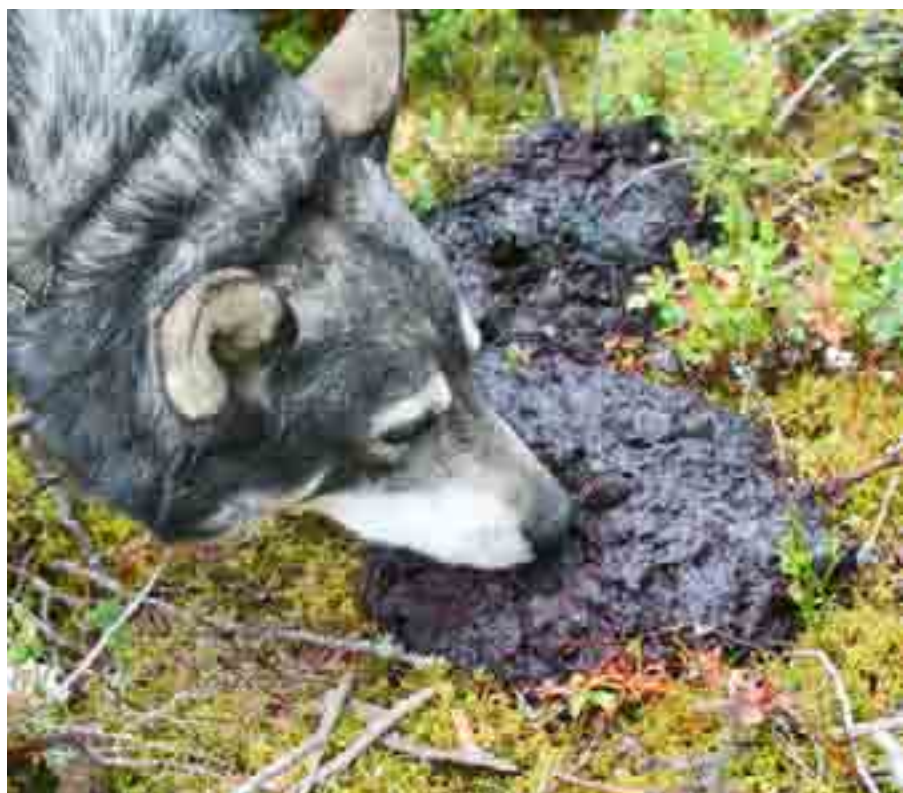
Den här hunden verkar vara på rätt spår.