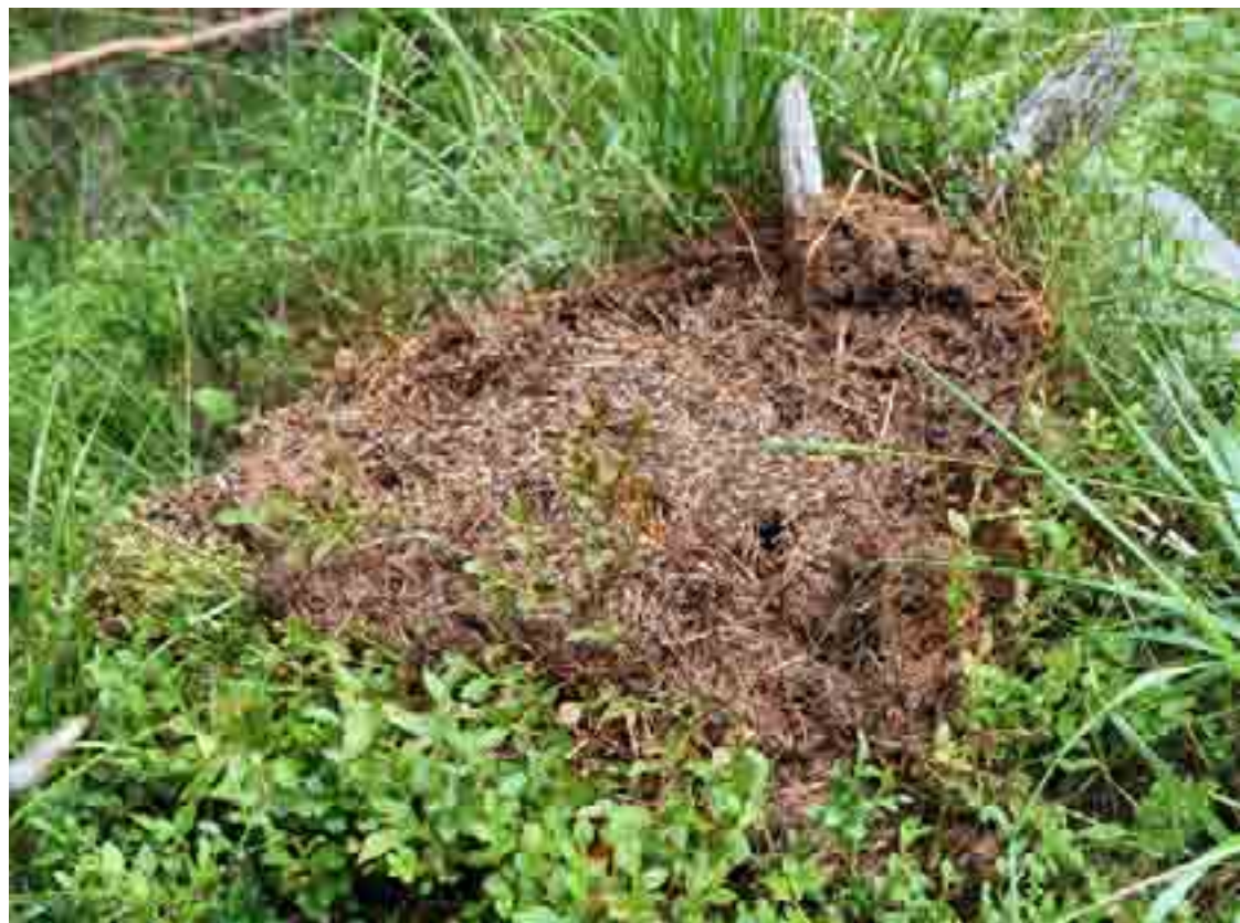
En utriven myrstack vittnar om att en björn har gått förbi.

I en jaktsituation är inte björn ett naturligt byte för hunden, i