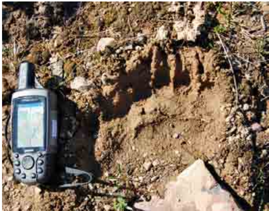
Med hjälp av GPS-sändare kunde forskarna kontrollera hur väl hunden följde en speciell björnindivid.

Totalt 29 hundförare deltog i studien. Hundförarna utför efter-